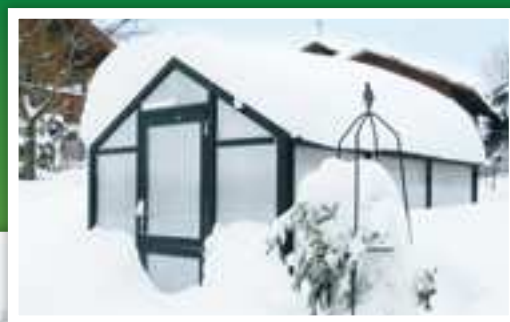
Orangeriet er designet til at kunne klare høje vindhastigheder og store sne-belastninger