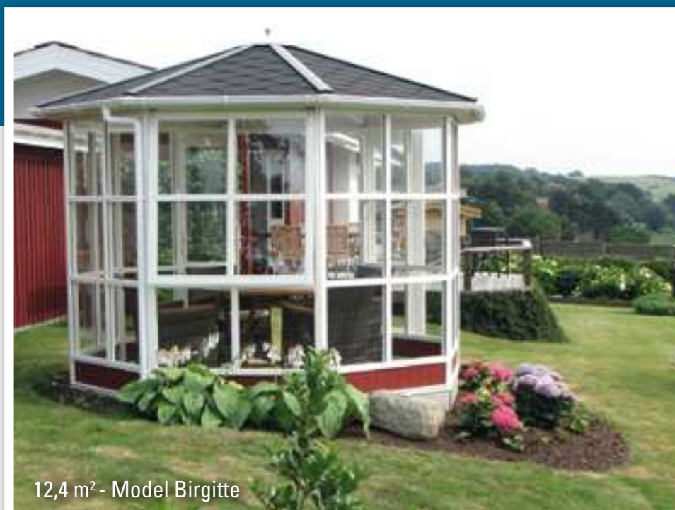
12,4 m 2 - Model Birgitte