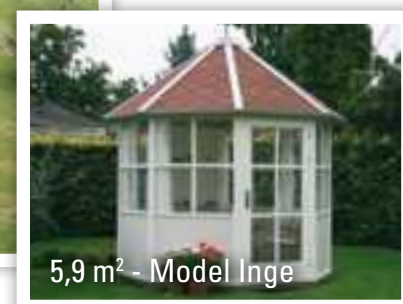
5,9 m 2 - Model Inge

Priserne er for færdigmalet pavillon incl. gulv