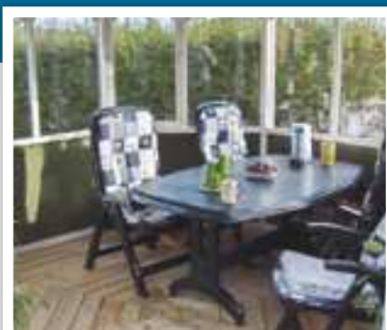
Interiørfoto 8,2 m 2