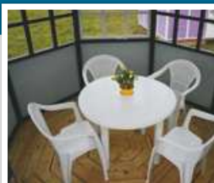
Interiørfoto 5,9 m 2

Hvor stor en model, man skal vælge afhænger naturligvis af, hvordan man påtænker at bruge pavillonen. Generelt bliver de gæster, der besøger vores udstillinger overraskede over, hvor rummelige pavillonerne er i virkeligheden. F.eks. er der rigelig plads til et bord til 4 personer i en pavillon på 5,9 m 2 , og modellen på 12,4 m 2 kan rumme helt op til 16 personer. Billederne nedenfor kan give et indtryk af de forskellige størrelser.