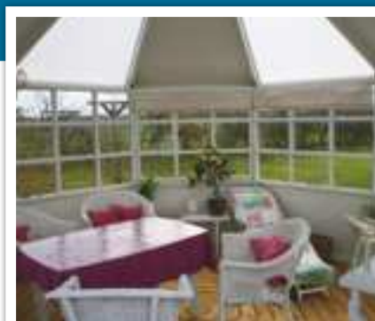
Interiørfoto 12,4 m 2